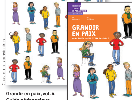
Grandir en paix, vol. 4 Guide pédagogique

21 x 19,7 cm ISBN 978-2-606-01626-5 À paraître