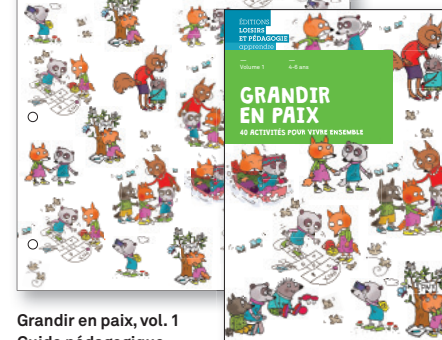
Grandir en paix, vol. 1 Guide pédagogique

21 x 19,7 cm, 240 pages ISBN 978-2-606-01616-6 Prix CHF 43.- / € 42.-