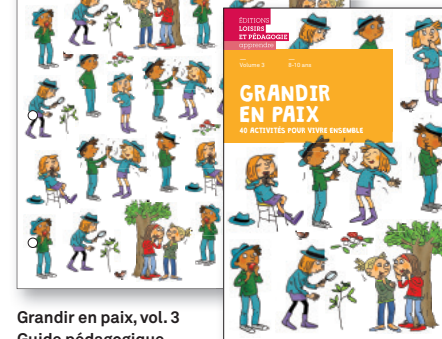
Grandir en paix, vol. 3 Guide pédagogique

15 x 21 cm, 264 pages ISBN 978-2-606-01624-1 Prix CHF 47.50 / € 46.60