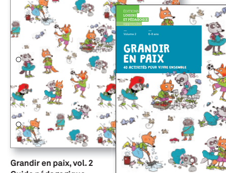
Grandir en paix, vol. 2 Guide pédagogique

21 x 19,7 cm, 224 pages ISBN 978-2-606-01618-0 Prix CHF 40.- / € 39.10