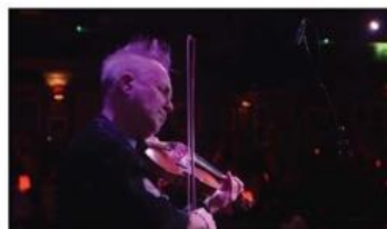
Violinist Nigel Kennedy... a one-off performance for an audience that was engaged and appreciative to the point of a standing ovation, even after the musician had left the stage.

05/09/2019 Review / Nigel Kennedy's 'very special' experience | Canberra CityNews Review / Nigel Kennedy's 'very special' experience By CityNews - January 26, 2019 Share Canberra's trusted news: