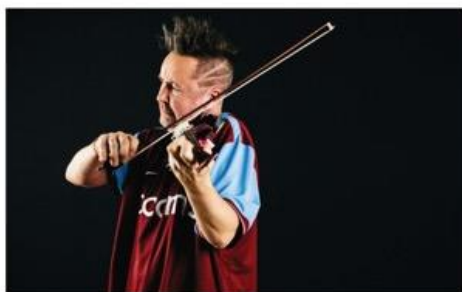
Violinist Nigel Kennedy in his beloved Aston Villa shirt.

05/09/2019 Nigel Kennedy, The New Four Seasons tour, Colston Hall, Bristol, review: 'always restlessly exploring' Nigel Kennedy, The New Four Seasons tour, Colston Hall, Bristol, review: 'always restlessly exploring' ★★★★★