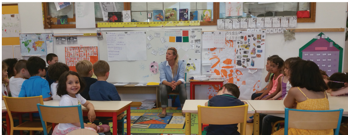
École de Segny (département de l'Ain en France) qui a testé les activités de la collection Grandir en Paix

2015 a marqué une étape essentielle avec la mise en place de notre structure locale française. Désormais membre de la Coordination pour l'éducation à la non-violence et à la paix, l'association Graines de Paix – France a multiplié les rencontres, les réunions de travail et recherches de fonds afin de se faire connaître et de développer son activité. Ces démarches ont ouvert les portes de possibles programmes pour les écoles, les enseignants et le parascolaire. Par ailleurs, des collaborations transfrontalières se sont concrétisées en 2015 avec la participation de deux écoles de l'Ain, ainsi que d'une conseillère pédagogique à l'évaluation des activités. Des contacts ont également été pris avec le Délégué ministériel à la prévention et à la lutte contre la violence à l'école afin de coordonner et préparer l'approche du système éducatif français.