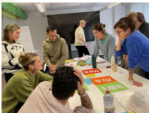
Formation des 17 et 18 novembre 2025

Pour accompagner le déploiement de la phase 3, Graines de Paix a proposé une formation adaptée aux contraintes des centres socioculturels. La formation s'est déroulée sur deux jours, selon deux modalités possibles :