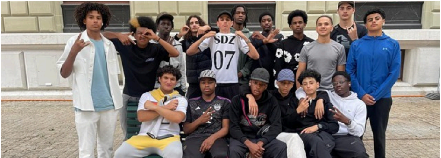
Jeunes d'une maison de quartier, Genève