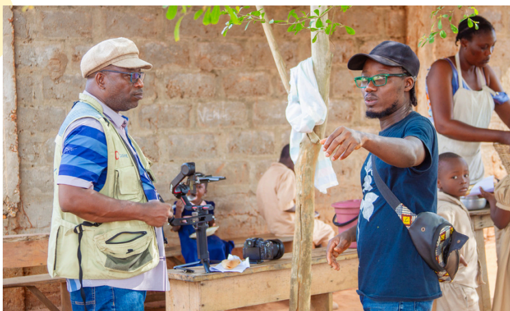
Tournage en cours des trois vidéos pédagogiques

Entre juillet et décembre 2025, trois vidéos pédagogiques ont été scénarisées pour compléter les ressources scolaires et communautaires. Ces vidéos présentent des situations pédagogiques issues des activités du programme, en impliquant enseignants, parents, leaders communautaires et enfants.