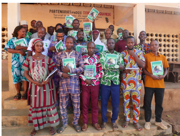
Formation en cascade à Kouande

D'octobre à décembre 2025, les formateur-trices ont assuré à leur tour la formation de quatre groupes successifs d'environ 30 enseignant-es, sur une durée de 4 jours par session, pour un total de 10'060 enseignant-es formé-es.