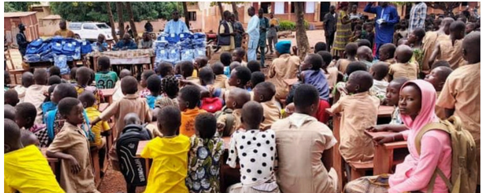
Distribution kit scolaire Atacora