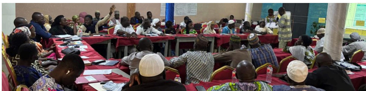
Formation à Alibori

Au total 232 animateur-trices ont été formé-es, dont 115 travailleur-euses sociaux-ales du Ministère des Affaires sociales et de la Microfinance (MASM) et 117 représentants des leaders religieux, de la chefferie traditionnelle et des associations de parents d'élèves. Par ailleurs, 15 maires et élu-es locaux de communes frontalières ont participé à deux journées de formation au côté des animateur-trices.