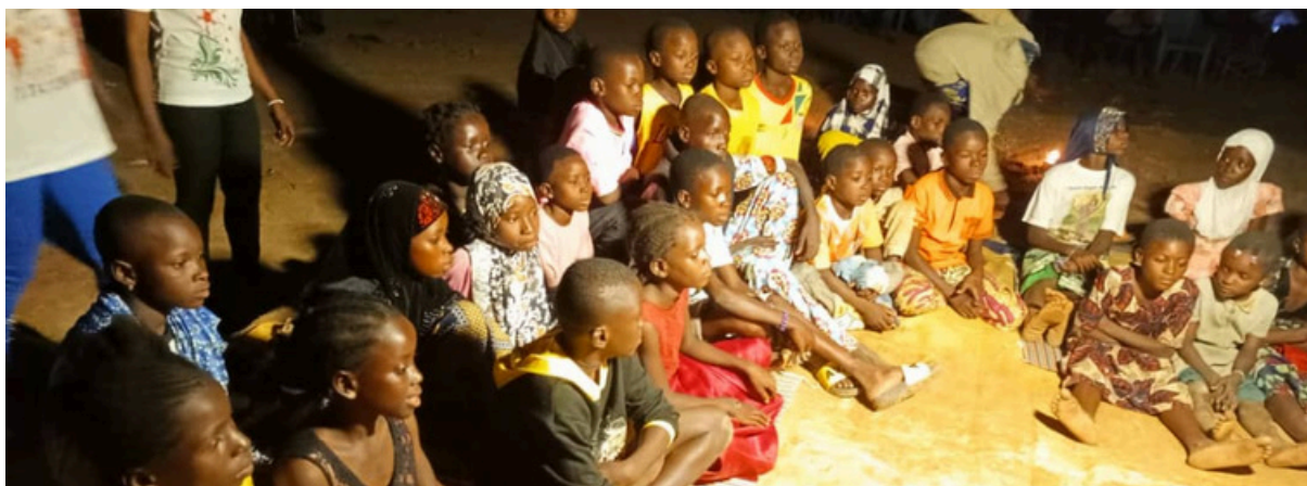
Nuit des contes à Banikoara

L'activité a également permis de documenter l'utilisation des contes comme support d'animation éducative au sein des centres communautaires, en lien avec les objectifs du programme.