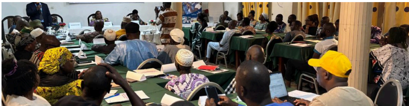
Formation à Parakou des formateur-trices

De septembre à décembre 2025, quatre sessions de formation des formateur-trices, pendant quatre jours chacune, ont été organisées progressivement dans les départements de l'Alibori (35), de l'Atacora (35), du Borgou (36) et de la Donga (35), pour un total de 141 formateur-trices formé-es (21 femmes et 120 hommes).