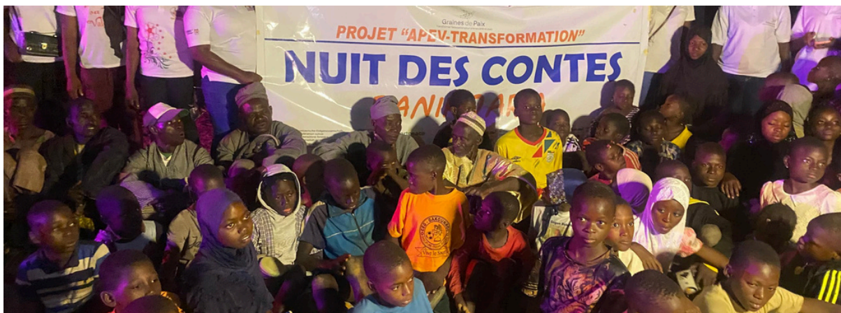
Nuit des contes à Banikoara

L'activité a également permis de documenter l'utilisation des contes comme support d'animation éducative au sein des centres communautaires, en lien avec les objectifs du programme.