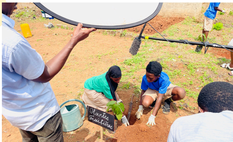
Tournage en cours des trois vidéos pédagogiques

Entre juillet et décembre 2025, trois vidéos pédagogiques ont été scénarisées pour compléter les ressources scolaires et communautaires. Ces vidéos présentent des situations pédagogiques issues des activités du programme, en impliquant enseignants, parents, leaders communautaires et enfants.