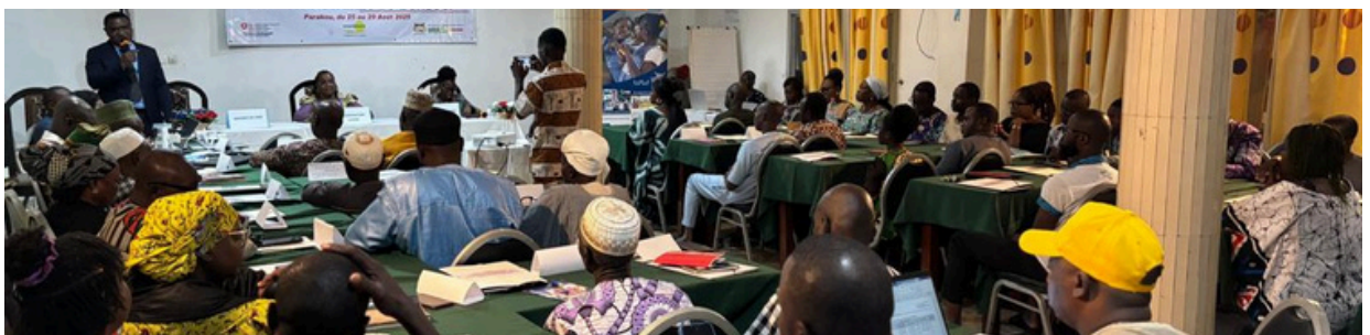
Formation à Parakou

Au total 232 animateur-trices ont été formé-es, dont 115 travailleur-euses sociaux-ales du Ministère des Affaires sociales et de la Microfinance (MASM) et 117 représentants des leaders religieux, de la chefferie traditionnelle et des associations de parents d'élèves. Par ailleurs, 15 maires et élu-es locaux de communes frontalières ont participé à deux journées de formation au côté des animateur-trices.