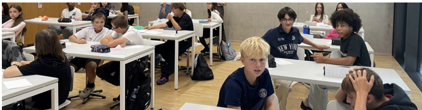
Atelier mené le 24 septembre 2025 – élèves de 9CO

À la rentrée scolaire 2025–2026, l'un des cycles d'orientation partenaires a intégré le programme Bien Vivre Ensemble dans son dispositif d'accueil des nouveaux élèves de 9 CO. Deux journées dédiées à l'intégration ont ainsi été organisées les 24 et 25 septembre, avec des activités adaptées à chaque niveau scolaire.